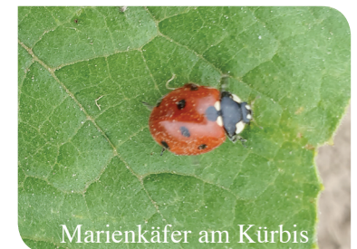
Marienkäfer am Kürbis

Wir fördern Diversität und das Natürliche!